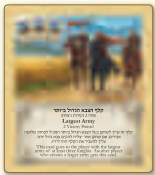
הצבא הגדול ביותר